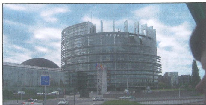
Štrasburk – Evropský parlament

V průběhu exkurze nám bylo umožněno navštívit jeden z depozitářů (kovová, podezděná, jednopodlažní budova vybavená posuvnými i pevnými regály), v němž je mimo jiné uložena velká sbírka vojenských map z 19. i 20. století, ze-