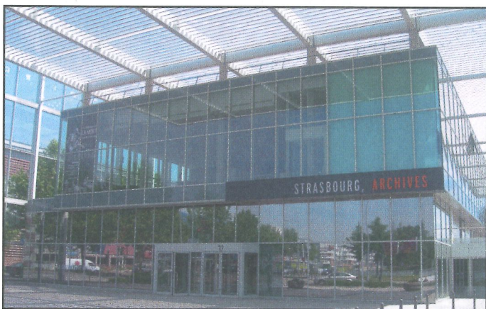
Štrasburk – Archiv města

O písemnosti v archivu uložené pečuje 27 zaměstnanců (devět archivářů, jeden fotograf, dva restaurátoři, šest manipulantů a technický personál). Ve velkém a účelně zařízeném ateliéru pracují podle norem francouzského Národního archivu dva restaurátoři. Kromě knih opravují především plány a grafiky. V centru naší pozornosti podobně jako ve Freiburgu byl postup a způsob digitalizace archivních fondů. Veškeré digitalizační a reprografické práce v městském archivu zajišťuje jeden fotograf, který se věnuje objednávkám badatelů a zakázkám pro výstavy, muzea a katalogy, tj. pracuje především s obrazovými archiváliemi. Převážně textové fondy jsou digitalizovány externí firmou. Fotoateliér je vybaven moderní technikou, na jednom ze tří skenerů je možné zpracovávat i skleněné negativy, kterých je v archivu uloženo 50 000. Postupuje i digitalizace map, grafik, plánů a pozemkových knih. Na vlastních webových stránkách archiv zpřístupňuje