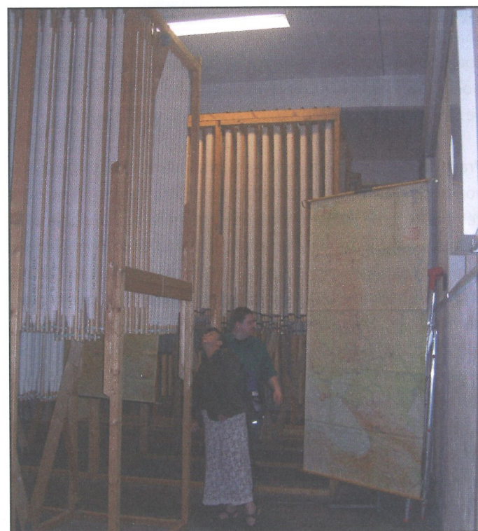
Freiburg a. B. – Militärsarchiv – Sběrka map

exkurze navštívili, byl Archiv města Štrasburku, který sídlí ve zcela novém objektu dokončeném v roce 2004. Spoluprací budoucího uživatele a architekta vznikla reprezentativní archivní budova s ekologicky šetrnou klimatizací a ochranou