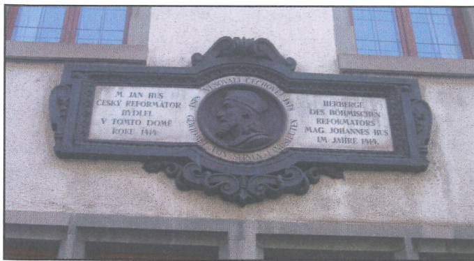
Kostnice – J. Hus

V programu každé exkurze pořádané Pobočkou ČIS při Národním archivu je věnována pozornost také poznávání kulturních a přírodních památek a tradic navštíveného regionu a míst, která spojují jednotlivé oblasti s českými dějinami. Tentokrát to byla mimo jiné velká města Heidelberg, Štrasburk, Basilej a Kostnice a v Alsasku města a městečka vinařské stezky na obou březích Rýna (Thann, Colmar, Equisheim, Riquewihr, Kaysersberg – rodiště Alberta Schweitzera, Otmarsheim),